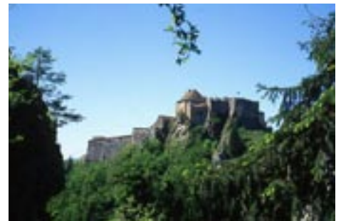
• Le Fort de Joux, situé dans le Doubs (France)