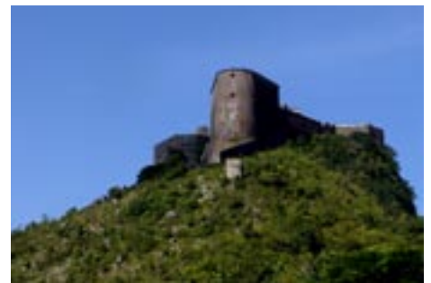
• La Citadelle Henry dans le Nord (Haïti)