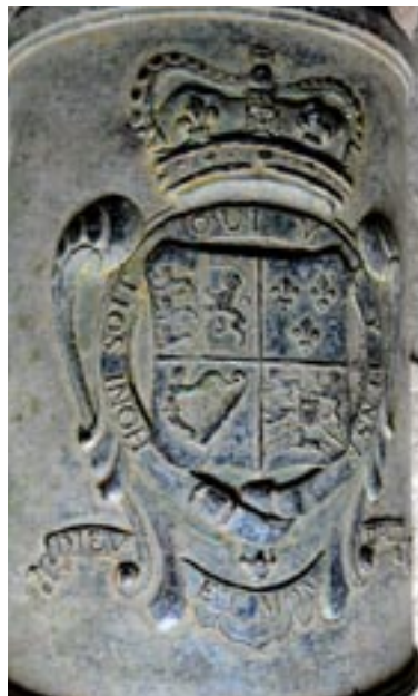
• Les Grandes Armes d'Angleterre