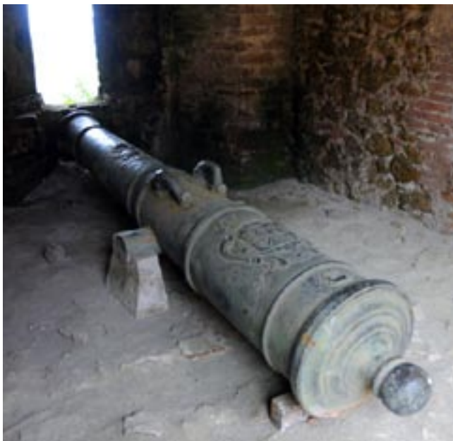
• Le canon de la Citadelle Henry orné des armes de Jhon Churchill