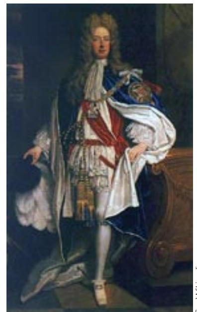
• Portrait de John Churchill,